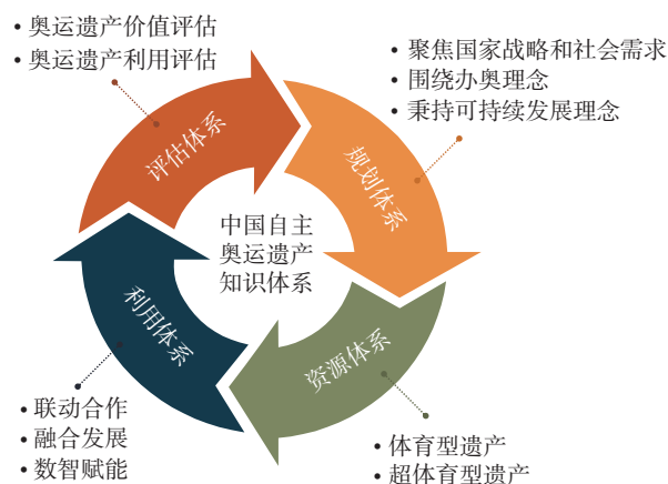
图1 中国自主奥运遗产知识体系总体框架

通过申办、筹办、举办奥林匹克运动会逐步建构和发展起来的,关于奥运遗产规划、资源、利用和评估等方面的理论知识与实践经验的总和,旨在全面指导中国如何有效地创造、保护和利用奥运遗产,以促进公众、城市和区域发展以及奥林匹克运动的长期利益。在《遗产战略方针》中,治理是奥运遗产工作的重要实践环节之一。但笔者认为,奥运遗产内容丰富、涉及领域广泛,在前期规划、资源管理、利用传承和后期评估中无不渗透着治理思想,它不仅是一项工作环节,更是一种工作原则或思维统领奥运遗产实践。鉴于此,本文从奥运遗产规划、资源、利用和评估4个方面构建中国自主奥运遗产知识体系的总体框架(图1)。